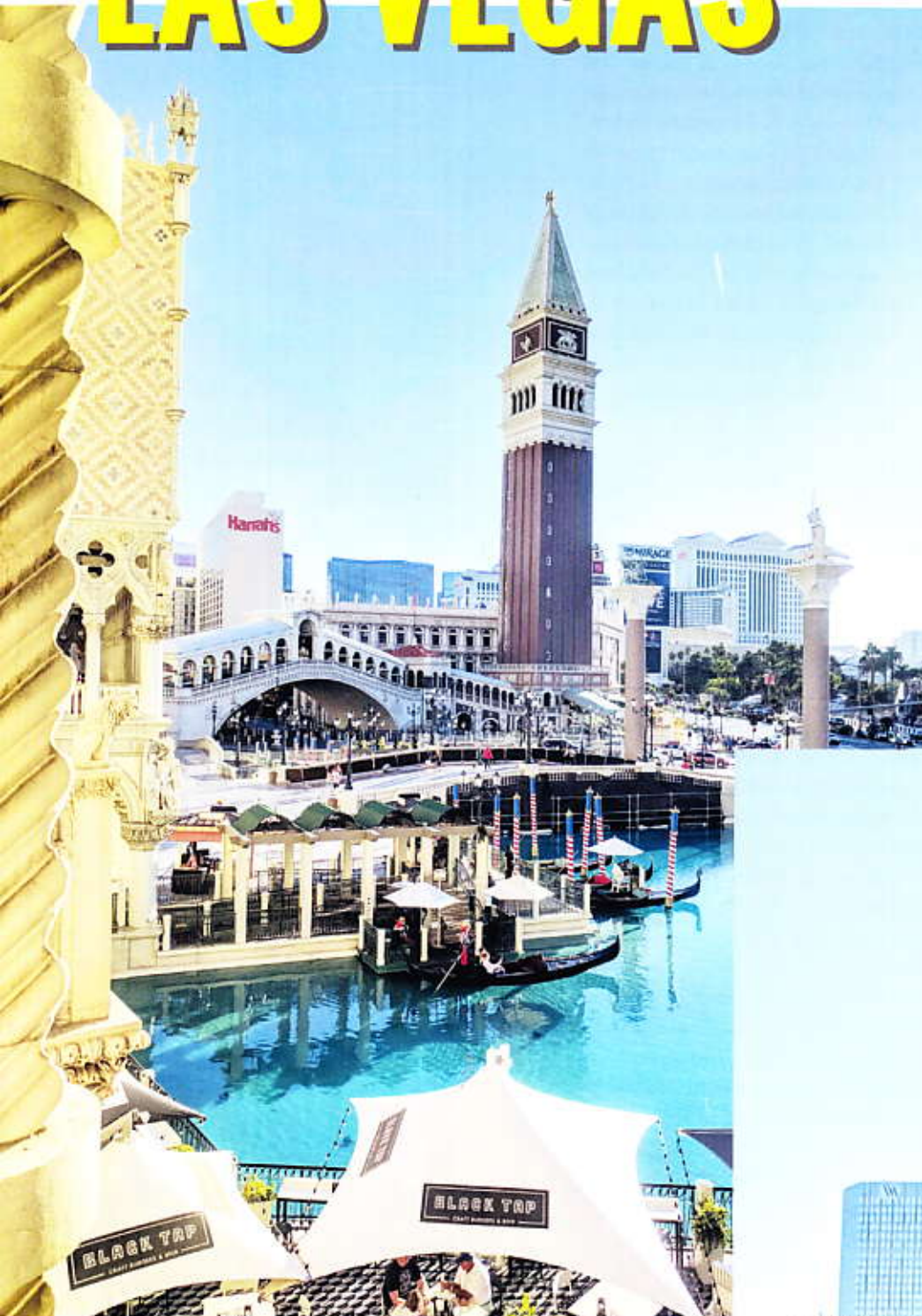
Illusionskunst: The Venetian (oben). Rechts: Hotels am weltberühmten Strip.

Landung auf dem McCarran International Airport. Schon in der Ankunftshalle klingeln die Spielautomaten. Fahrt mit dem Taxi ins „Cosmopolitan“ am Strip. Das Hotel spielt mit dem leicht verruchten Image von Las Vegas („Just the Right Amount of Wrong“). Ein Dutzend Restaurants, Shopping Arkade, Spielkasino, drei Pools lassen kaum einen Wunsch nach Zerstreung offen. Wer ein Zimmer in einem der höheren Stockwerke nach