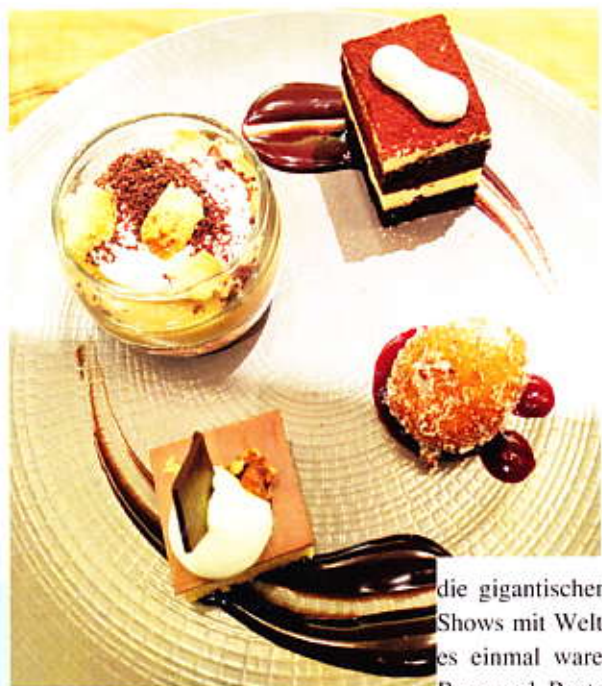
Desertkombination von Wolfgang Puck.

Wir lassen uns mit vielen anderen Stadtbesuchern den Strip entlangtreiben, wundern uns über die mit riesigen Pfauenfedern und winzigen Stoffteilchen dekorierten Showgirls, die gegen Honorar für ein Foto posieren, über